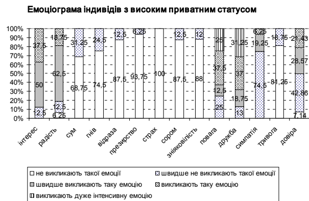
Рис.3. Емоціограма індивідів з високим приватним статусом.

Висновки. Таким чином, дістало подальшого розвитку вивчення впливу емоцій на особистий статус на основі даних соціометричних досліджень, що дозволило виділити специфіку емоціограм професійного та приватного особистого статусу та надало можливість більш глибокого розуміння впливу емоцій на групові процеси.