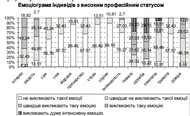
Рис.2. Емоціограма індивідів з високим професійним статусом.

Порівняльний аналіз емоціограм приватного та професійного статусу (див.рис.2, 3) демонструє пряму залежність статусних емоцій (поваги та довіри) та особистого статусу з тією особливістю, що повага є більш принциповою для професійного статусу порівняно з приватним.