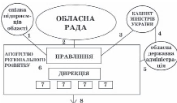
Рис. 1. Проектна організаційно-правова модель агентства регіонального розвитку в Україні

Така модель може бути більш детально зображена в організаційно-функціональному вигляді завдяки схемі на рис. 1 та коментарям до нього. Відповідно до запропонованої моделі до Правління АРР Кабінет Міністрів та спілка підприємців делегує нерівну з обласною радою кількість членів правління. Наприклад, обласна рада делегує трьох представників, Кабінет Міністрів України та спілка підприємців області – по одному. Така пропорція представників у Правлінні дає можливість обласній раді здійснювати керівний вплив на АРР, але при цьому за представниками Кабінету Міністрів України та спілки підприємців області залишається право вето з визначеного переліку питань, серед яких можуть бути інвестиції у розмірі понад визначений обсяг коштів.