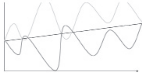
Рис. 1. Модель управления экономическим ростом

от «скачкообразной» цикличности развития к поступательному, возможно даже бескризисному росту экономики страны. Возможно такая методика сдерживания несколько затормозит улучшение уровня жизни того или иного государства, но это даст возможность нивелировать последствия цикличности кризисов капиталистических экономик. Другими словами, в период роста государство должно его ограничивать, накапливая ресурсы для того, чтобы в период кризисов вливать эти ресурсы в поддержание экономики. В принципе все государства, так или иначе, формируют свои резервные фонды в период роста, но в данном случае речь идет не о простом получении профицита бюджета, а об усилении давления на экономику с целью сдерживания ее роста. Графически представляется следующая модель (рис. 1) экономического роста.