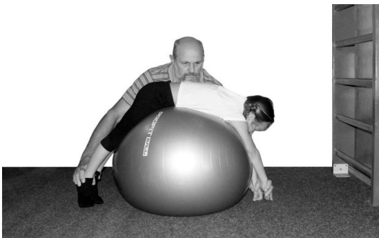
Фото 2. Корекція хребта і грудної клітини в положенні дитини на животі

В положенні лежачи на животі на м'ячі можна утримувати руки дитини за кисті та стопи (фото 2).