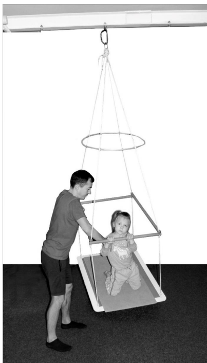
Фото 3. Тренажерна конструкція «Зореліт»

Подібні ритмічно-розгойдувальні рухи ми використовували також на авторському тренажері «Зореліт» (фото 3). Системне використання цієї конструкції також дозволило зафіксувати описані вище позитивні корекційні впливи на психомоторну сферу дітей із порушеннями опорно-рухового апарату та затримкою мовленнєвого розвитку (Єфименко, & Мога, 2011).