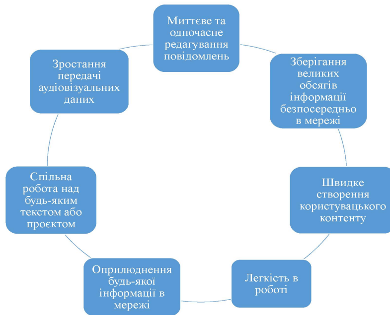
Рис. 1.2. Особливості які сприяють поширенню та розвитку цифрової дипломатії Розроблено автором за матеріалами (Алешкіна, 2018)

Українське МЗС також повідомило про нововведення – здійснення першого в історії «віртуального візиту» міністра до Німеччини для проведення онлайн-переговорів. Окрім певних протокольних деталей, більшість основних елементів звичайного робочого візиту були збережені, включаючи двосторонню зустріч і спільну заяву для преси. Враховуючи перший успішний досвід, можна чекати на продовження цієї практики. Втім, прискорений перехід із конференц-залів на онлайн-майданчики не лише розширив можливості регулярного діалогу та оперативного обміну інформацією, а й створив нові виклики, які можуть суттєво вплинути на майбутнє дипломатичних відносин. Спірним залишається питання прийнятності використання нових технологій щодо політичних самітів вищого рівня. У сфері комунікацій було здійснено значний прорив, і навіть найменші технічні проблеми цілком здатні перешкоджати імпульсу зустрічі, роблячи досягнення компромісу ще складнішим. Окремо слід зазначити і непересічну роль перекладача у подібних форматах переговорів. Деякі сучасні платформи для онлайн-конференцій (зокрема популярний зараз Zoom) передбачають спеціально виділені канали для дистанційного синхронного перекладу. Але важливо розуміти, коли перекладач знаходиться на відстані тисячі миль від переговорників, якісь проблеми зі