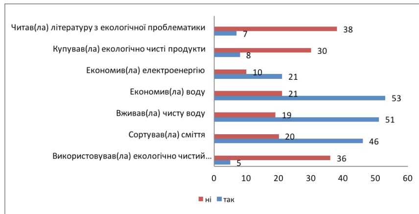
Рис. 1. Екологічні практики городян (%)

Як показано на рис. 1, найбільш розповсюдженими практиками мешканців міста є споживати очищену воду (51%), економити воду (53%), сортували сміття (46 %). За позицією «економили електроенергію» вибір респондентів склав 21%. У всіх інших заходах громадяни практично не приймають участь. Отримані дані свідчать про низький рівень екологічної активності мешканців міста.