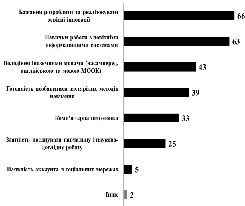
Рис. 1 Якості викладачів, які складають їхній креативний потенціал в умовах електронної освіти (Відповіді респондентів на запитання: «Які якості є найбільш важливими для викладача в умовах електронної освіти» (у %, експертні оцінки, n = 260, 2016 р., Україна)

На думку майже двох третин експертів (63 – 66 %), серед якостей викладачів мають переважати мотиваційні орієнтації у вигляді бажання розробляти та реалізовувати освітні інновації, до яких належать елементи електронної освіти. Також важливо викладачам мати навички роботи з новітніми інформаційними системами.