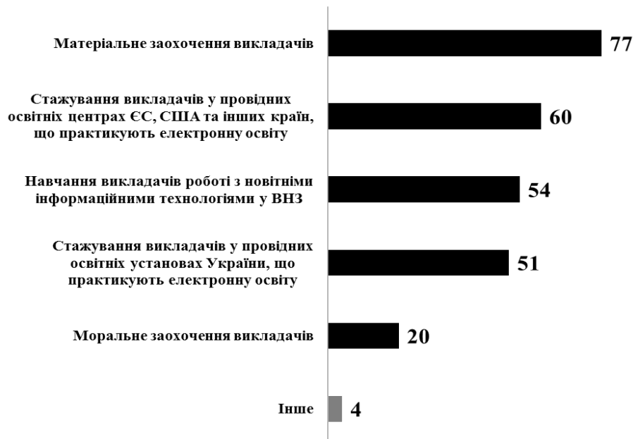
Рис. 2 Заходи із залученням викладачів до впровадження електронних технологій навчання, які експерти вважають найбільш доцільним в Україні (у %, n = 260, 2016 р., Україна)

Це може сприяти підвищенню креативного потенціалу викладачів і через нього їхній конкурентоспроможності на ринку електронних освітніх послуг, який розвивається і розширюється високими темпами. «Для розширення використання перспективних технологій необхідно поширювати інформацію про їх позитивний вплив на навчальний процес, а також надавати організаційну підтримку викладачам – навчати їх використанню мультимедійних технологій і впровадженню їх в освітні практики» [11, с. 74].