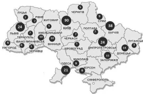
Рис. 1. Регіональний розподіл ВНЗ України

ми Вступу–2016 не набрали студентів на перший курс). Регіональний розподіл ВНЗ можна побачити на рис. 1.