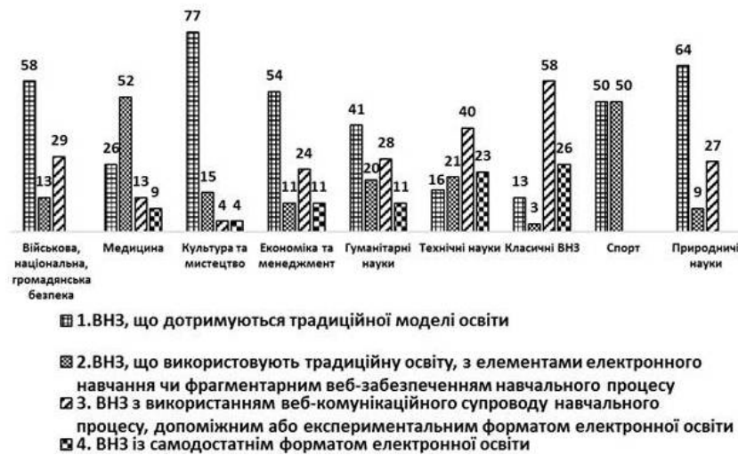
Рис. 4. Розподіл ВНЗ України різних напрямів (профілів) підготовки за ступенем їх включеності до електронного навчання (%)