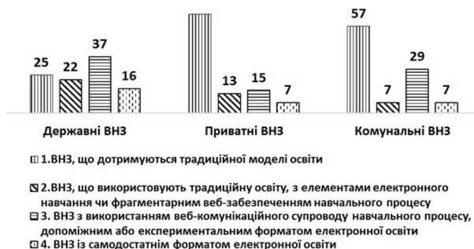
Рис. 3. Розподіл ВНЗ України різної форми власності за ступенем їх включеності до електронного навчання (%)

Загалом українські ВНЗ усвідомлюють необхідність та потребуваність дистанційної форми навчання і декларують подальшу інтенсифікацію процесів впровадження технологій дистанційного навчання, що знаходить відображення у концепціях та стратегіях розвитку окремих ВНЗ.